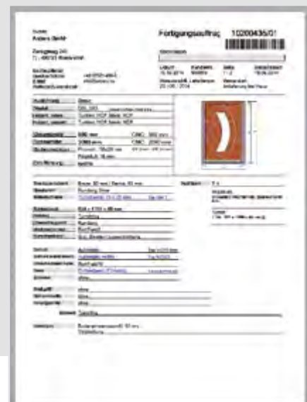
Abb. rechts: Fertigungspapiere