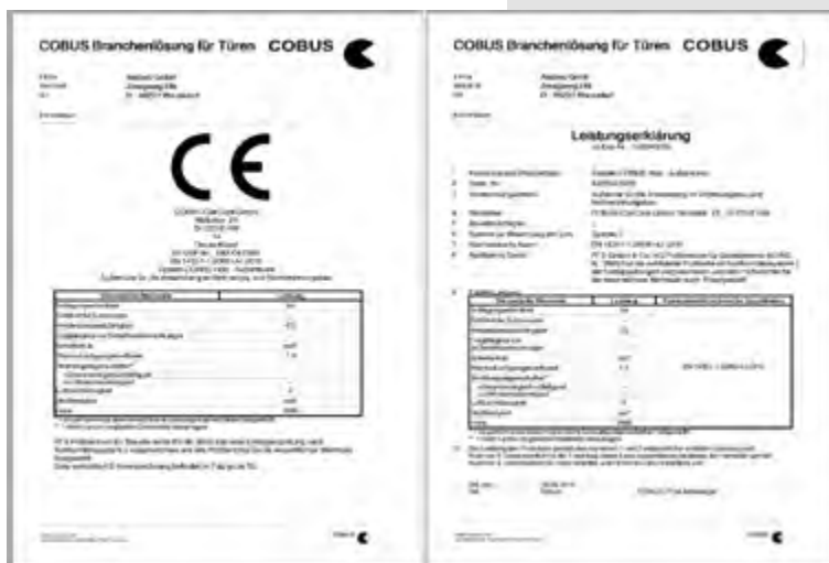
Abb. oben: CE-Leistungserklärung

Hier können auch Etiketten mit einem Barcode ausgestattet werden, so dass die integrierte Betriebsdatenerfassung das etikettierte Material, Kostenstellen und Zeitinformationen aufnehmen kann. Die Betriebsdaten sind dann selbst im Kundenauftrag abrufbar, so dass Sie den Produktionsstatus immer im Überblick haben.